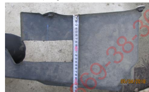
Рис.2 Вырез в левом пыльнике.

4.8. Сделать вырез в левом пыльнике 68х155 мм (см. рис.2).